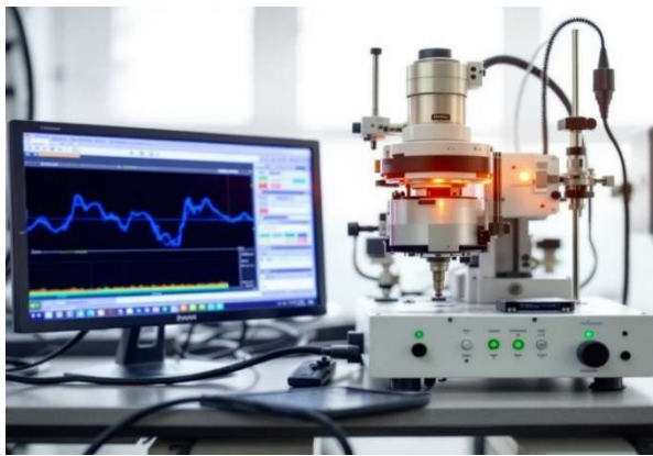
Рисунок 1. Проект комплексу реєстрації оптичних сигналів. Формування сигналу → Поширення в середовищі → Перетворення фотонів у струм → Програмна обробка та аналіз сигналу → Візуалізація / Збереження

Розробка структурної та функціональної схеми КРОС. Створення навчального комплексу комплекс реєстрації оптичних сигналів (КРОС) складається з таких основних елементів: оптичне джерело; оптичне середовище (волокно або повітря); фотоприймачі – в залежності від фізичних явищ, які визначають принцип дії, приймачі оптичного випромінювання використовуються декілька груп; комп'ютерна система обробки (ПК з програмним забезпеченням).